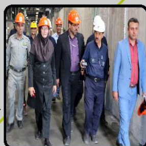
بازدید مدیرکل محیط زیست استان از کارخانه گاز مسی