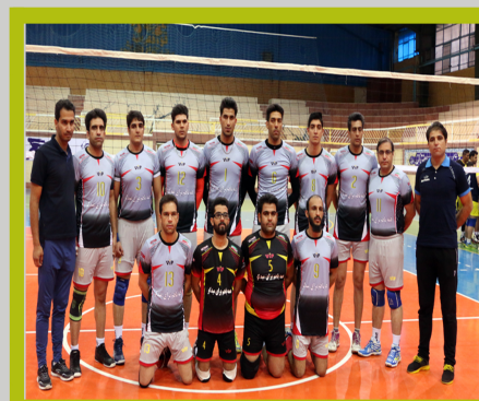
تیم والیبال آقایان شرکت بابک مس ایرانیان