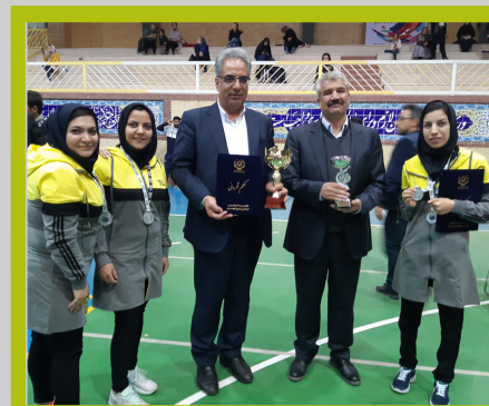
کسب مقام دوم تنیس روی میز گروهی بانوان