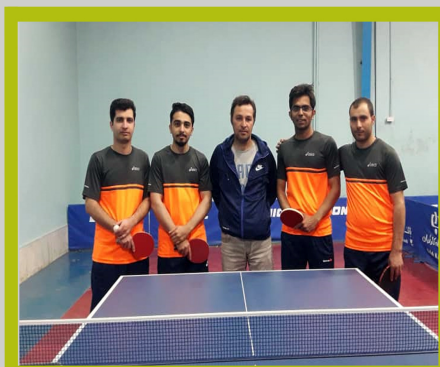
تیم تنیس روی میز آقایان شرکت بابک مس ایرانیان