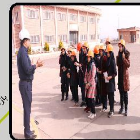
بازدید دانش آموزان از کارخانه لوله مسی