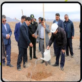
مهر امجدانیت روز درختکاری