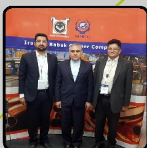
بازدید سفیر ایران در قطر از غرفه بابک مس