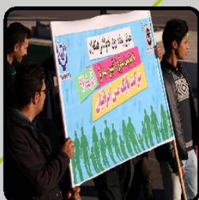
همایش پیاده روی خانوادگی