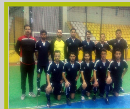
تیم فوتسال آقایان شرکت بابک مس ایرانیان