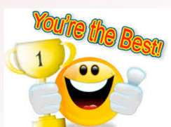
مجید طاهر نژاد