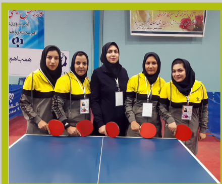
تیم تنیس روی میز بانوان شرکت بابک مس ایرانیان