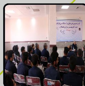
نشست صمیمی مدیرعامل با کارکنان